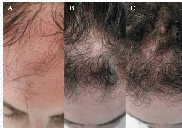
Figure 1 : Résultat après 6 mois et 20 jours par Photo Bio Modulation au Centre Du Cheveu (voir protocole type)

Il est non seulement possible de freiner la chute mais également d'augmenter, à terme, la densité de la chevelure.