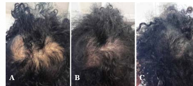
Figure 2 : Résultat après 9 mois et 13 jours par mésothérapie au Centre Du Cheveu (voir protocole type)

Combiné à la Photo Bio Modulation, ce véritable traitement de choc non invasif, cible de manière précise les cellules folliculaires sous 3 angles d'attaque différents : augmentation de l'énergie intra cellulaire, injection d'ingrédients actifs et électroporation. Il s'agit d'injecter certains principes actifs dans le cuir chevelu qui seront ainsi directement orientés vers le bulbe pour réduire la perte des cheveux et accélérer leur repousse. Cette technique agit comme un véritable booster biologique qui permet d'assurer, d'augmenter la qualité et la durée de vie des cheveux.